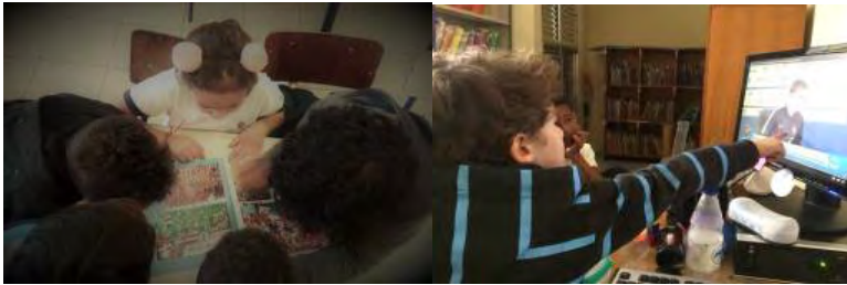
Pesquisas na internet, jornais e revistas.