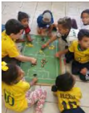
Futebol de Botão