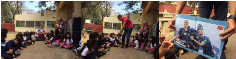
Roda de leitura e conversa