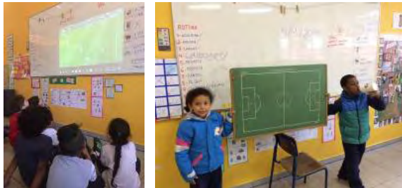
Assistência de trechos de jogos e conversa sobre regras com tabuleiro

Programamos para os momentos seguintes a assistência a trechos de jogos de futebol profissional masculino e feminino. Durante a exibição, desafiamos as crianças a prestarem atenção em tudo o que acontecia no campo e conversamos sobre elementos do jogo. Elas apontaram a existência de faltas, barreira, pênalti, lateral, tiro de meta e escanteio. Antes da segunda vivência de jogo, utilizando um tabuleiro de futebol de botão, convidamos quem quisesse a explicar as regras para a turma.