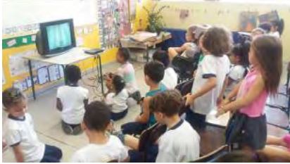
Futebol no videogame

Também realizamos atividades com diferentes tipos de futebol, formas de participação e pessoas envolvidas com essa prática corporal. Fizemos leituras de imagens e vídeos onde tal diversidade era evidente.