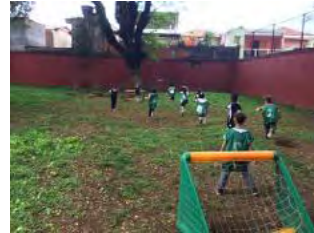
Golzinho no gramado