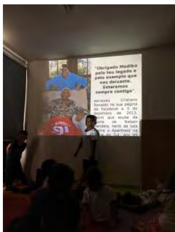
Visualização e leitura de imagens na sala de multimídia.

Surpresos com a reação das meninas, que até então participavam e demonstravam interesse, decidimos propor uma atividade que articulava a tematização do futebol com o projeto de estudo sobre a vida de Nelson Mandela, por considerar que as crianças estavam bem envolvidas na investigação da biografia e na produção do livro sobre o patrono, que representa uma figura de afeto para toda a comunidade. Seleccionamos imagens de Mandela com pessoas ligadas ao futebol e conversamos com as crianças sobre a relação dele com os esportes e com o futebol.