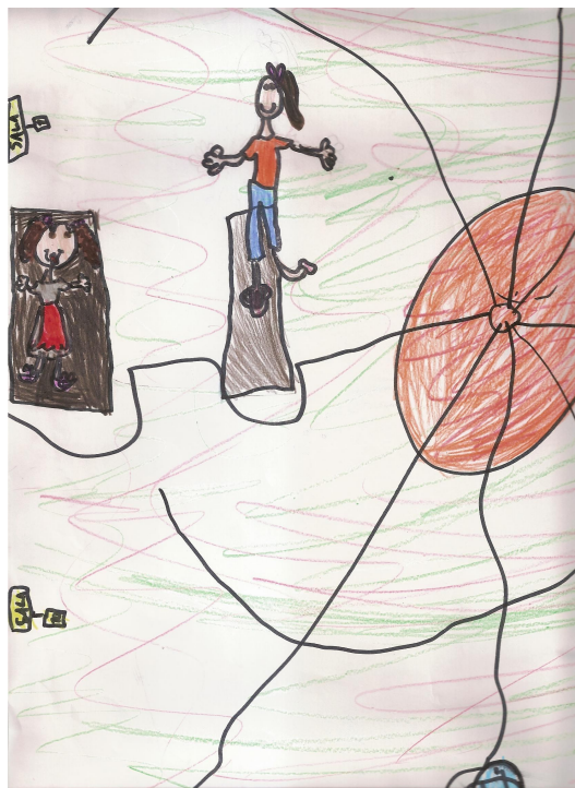
Figura 2. Exemplo de auto-retrato corporal demonstrando representação mais adequada do aluno no papel das partes do próprio corpo, após vivenciar as atividades propostas.

Depois das vivências propostas, os alunos foram convidados a desenhar novamente o seu próprio corpo, buscando retratar da maneira mais fiel possível a imagem que tem de si mesmo: