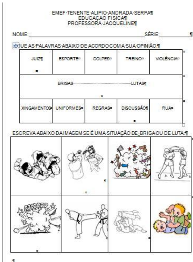
Figura 02 – Diferenças entre brigas e lutas

Após analisar o primeiro registro feito pelos os alunos, onde deveriam pintar os nomes das lutas, percebi que algumas lutas eram conhecidas pelo grupo enquanto outras não. A esgrima não havia sido identificada como uma luta por nenhum aluno, e por isso resolvi colocá-la em nossos estudos, pois dessa forma contribuiria para a ampliação dos conhecimentos dos alunos sobre as lutas. Inicialmente pensei em trabalhar com diferentes tipos de lutas que trouxessem um pouco da cultura de outros grupos. Essa escolha foi feita através de um processo de votação durante a aula, onde listamos na lousa as lutas que gostaríamos de estudar: boxe, judô, capoeira e sumô. Cada aluno votou em duas e as duas manifestações mais votadas foram eleitas para serem estudadas juntamente com a esgrima.