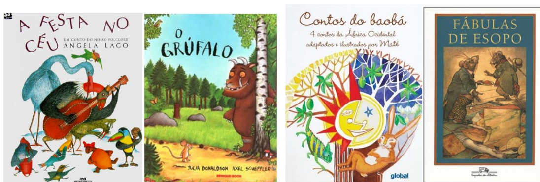
Imagem: Títulos das leituras do roteiro Hora da história

movimentos e aumentem seu repertório motor através de brincadeiras de faz de conta nas aulas de educação física.