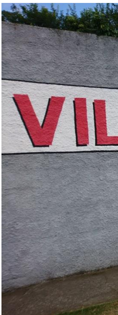
Chegada aparelhos e do