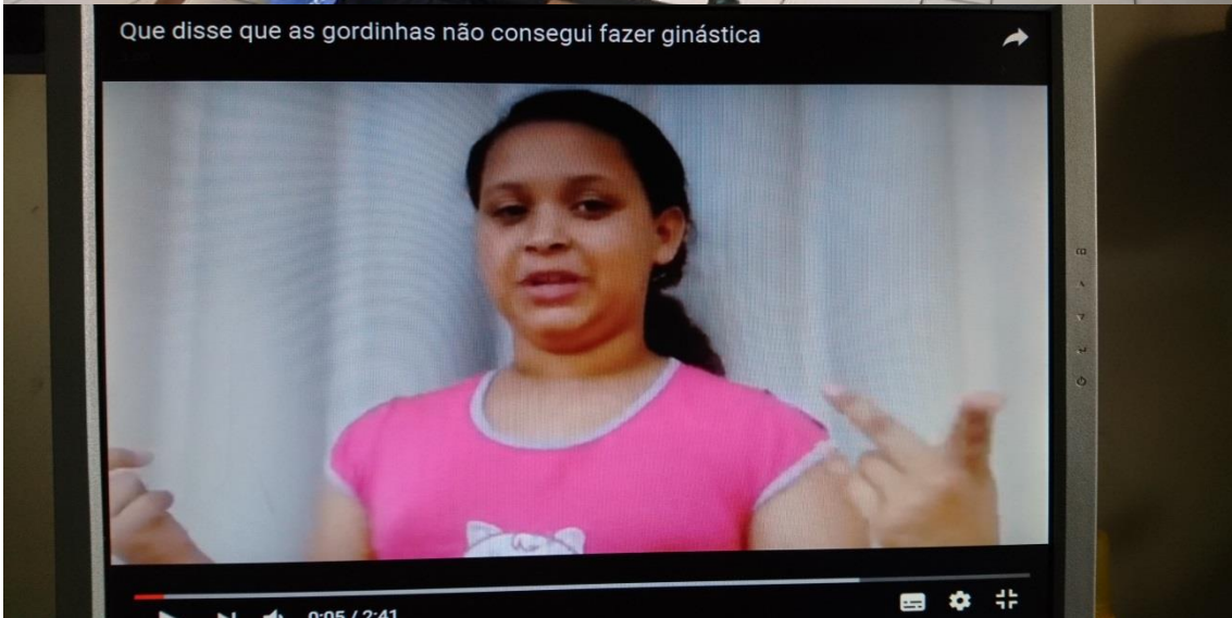
Aulas de alongamentos com o auxílio do colega.