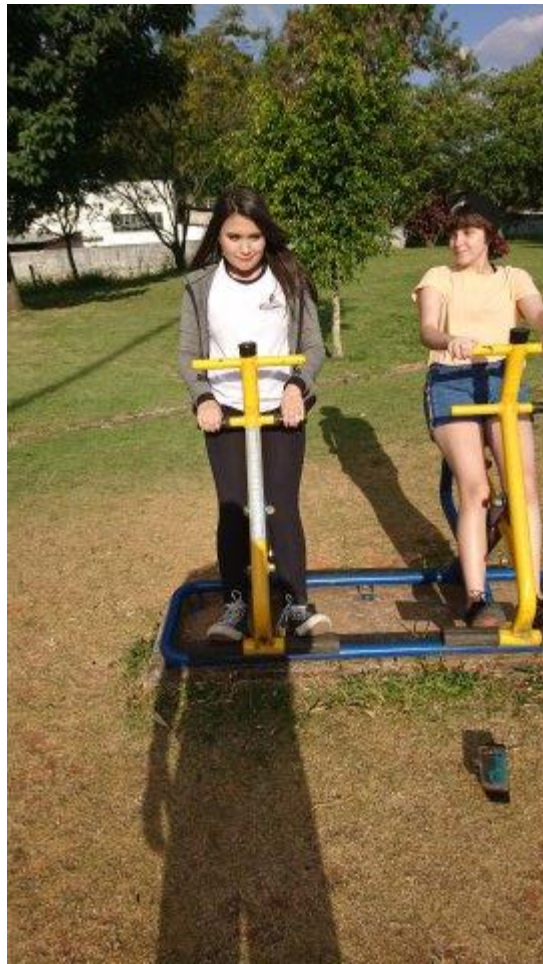
atividade parque!!! nos