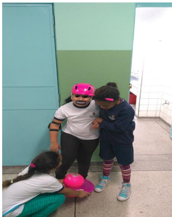
Criança subindo no pogobol com ajuda

Alguns materiais eram novidade para os viajantes da jornada, que ao tomarem contato com o que foi arrecadado ampliaram seu repertório sobre os brinquedos. “Que brinquedo é esse?” “É bola que pula”. “E tem de usar esses equipamentos aí?”. “Sim é para proteger”. Numa conversa com a doadora 1 dos brinquedos, a surpresa também não foi pequena: é um “Pogobol”. Viu que as crianças produziram suas práticas desviando artefatos de outro brinquedo, pois os equipamentos de proteção eram pertencentes ao patins e não ao que estava em uso.