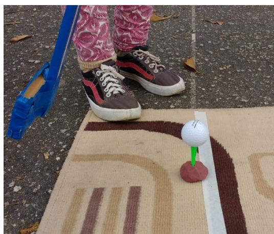
Figura 4 - Adaptação com a massinha para conseguirmos colocar o "tee" nos nossos jogos

O “tee” é um equipamento que precisa ser fincado na grama, na areia ou na terra, e as nossas aulas aconteciam no asfalto. Para solucionar esse problema, fizemos algumas bases de massinha para colocá-los e assim os estudantes puderam experimentar uma outra forma de dar as tacadas.