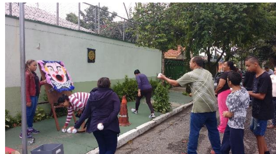
Figura 1 - Experimentando os jogos de pontaria - Basquete; Boliche; Argolas e Boca do Palhaço

Após a realização de todas as rodadas, onde cada estudante passou pelas quatro estações, notamos um grande interesse pelo basquete, afinal, é um jogo conhecido e que a maioria já viu pela televisão, o que lhes garantiam maior segurança para praticar. Deixamos essa anotação “na manga”, pois poderia ser uma possibilidade de escolha de tematização.