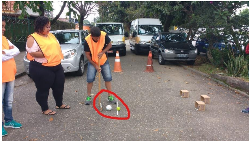
Figura 3- A tacada no gateball é feita em uma bola para que ela impulsione a outra bola que deve passar pelo gate .

a equipe que marcar mais pontos. Já o golfe é um esporte individual, que tem como objetivo acertar a bolinha nos 18 buracos do percurso com o menor número de tacadas, sem tempo determinado. Entre tantas diferenças existentes entre esses dois esportes, uma está na forma como se dá a tacada. No golfe o taco encosta diretamente na bolinha que será derrubada no buraco, já no gateball , bate-se o taco em uma bolinha que deve bater na outra bolinha, que deve passar pelo gate .