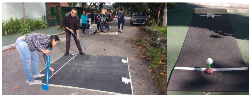
Figura 6 - Diferentes tapetes para as jogadas

As partidas durante as aulas começaram a ficar mais disputadas, pois alguns estudantes entenderam a lógica do jogo, porém não conseguíamos mudar de um espaço para o outro com as tacadas por causa da questão do asfalto e da inclinação da rua. Portanto o nosso jogo não tinha um percurso, mas uma ordem de tapetes em que se jogaria na sequência.