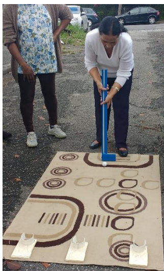
Figura 8 - Cada estudante escolheu a melhor forma para segurar o taco

Percebendo que as poucas possibilidades que o espaço físico nos oferecia estava esgotando a realização das práticas, sugerimos que na próxima aula fossemos realizar o jogo no Parque da Providência, que fica a 900 metros da escola. O parque não possui nenhum espaço específico para o golfe, apenas imaginamos a possibilidade de jogarmos em um espaço maior, plano e gramado. Os estudantes toparam e então combinamos que permaneceríamos lá durante todo o período da aula. Conversamos com as professoras das turmas e deixamos tudo organizado para a atividade no parque, o que inclui a autorização de saída para a participação em atividades externas para os estudantes menores de 18 anos e para os estudantes com deficiência. Quando marcamos atividades da escola nesse parque, alguns estudantes vão direto, pois seus ônibus param no ponto em frente ao parque e outros combinam de se encontrar na escola e vão caminhando em grupo.