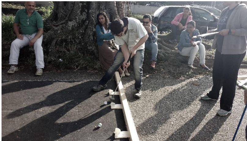
Figura 5- Enquanto alguns jogam os demais aguardam sentados.

De maneira geral todos se mostraram participativos e concentrados no jogo. Observamos um contentamento dos estudantes com deficiência por estarem participando de maneira efetiva assim como os outros estudantes., diferente do que havia acontecido no slackline. As alunas mais velhas também se apresentavam envolvidas com o trabalho. Em alguns momentos notávamos as pessoas sentadas observando a aulas, mas percebíamos que estavam aguardando a sua vez. O local onde as aulas acontecem geram esse “problema”. Por ser um espaço pequeno, e ter uma sombra de uma árvore na beirada da rua, os estudantes acabam por se sentar durante a espera. Se não estivermos atentas ao que está acontecendo, temos a sensação de que eles não estão na aula, mas ao observarmos bem, essa é uma prática comum de alguns estudantes. Muitas vezes eles se sentam para assistir os colegas. Enfim, a aula na rua gera outras configurações.