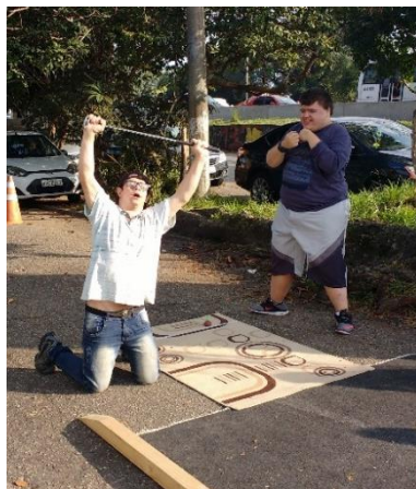
Figura 7 - Comemoração do estudante após vencer a partida

Aconteceram disputas bem acirradas e não tivemos um perfil de vencedores. Homens, mulheres, pessoas com deficiência, idosos, seja quem fosse, tiveram êxito nas disputas, visto que em alguns momentos contavam com a sorte, e que por não haver ninguém em condição superior com relação a essas vivências, todos estavam em condição de vencer.