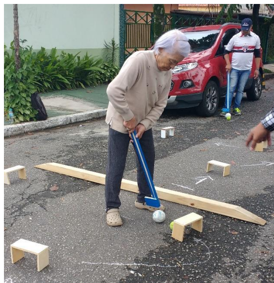
Figura 4 - Experimentando o Gateball

Para a realização em nossa escola, utilizamos caixas de papelão para confeccionar os arcos, mas a cada momento que a bolinha acertava o papelão o arco desmontava. Um estudante, que é marceneiro, se prontificou a fazer alguns arcos de madeira para ajudar nas nossas aulas e na aula seguinte ele trouxe o material. Outro ponto que estava dificultando o estudo do gateball era a inclinação acentuada da rua. Isso atrapalhava muito as jogadas e acabava por deixar o jogo chato, pois as jogadas sempre acabavam com a bola na sarjeta da rua.