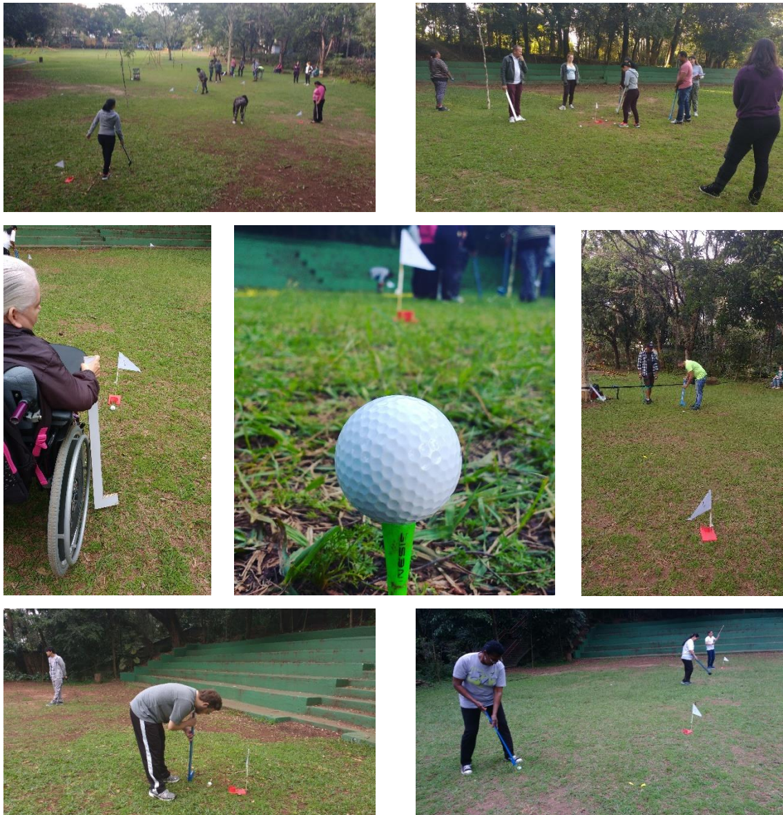
Figura 9- Imagens da vivência do golfe no Parque da Previdência

Finalizando o trabalho, conversamos com os estudantes e fizemos um levantamento do que foi estudado. Perguntamos o que eles haviam aprendido, o que gostaram, o que ficou faltando nas aulas, o que aprenderam. As respostas nos surpreenderam, pois achávamos que algumas coisas haviam passado despercebidas, mas eles mostraram que não.