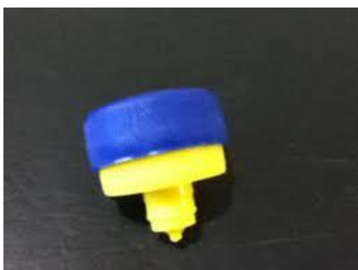
Pião com tampinha de detergente