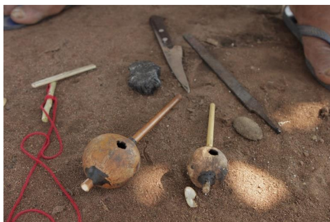
Pião com cabaça