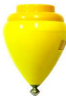
Pião de plástico