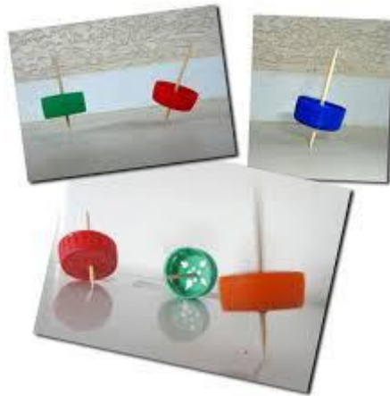
Pião com tampinha de garrafa pet

Em nova prática, os encontros seguiam, a desistência não era diferente, a fuga para produzir outras brincadeiras pintava com cores fortes, ao mesmo tempo que novas tentativas surgiam. “Professor, eu peguei na mão”. No trânsito diário, alguns estudantes do 9º ano apareceram. “O menor, não é assim, não. Empresta aí, é assim oh”. A segregação dos corpos foi burlada pela potência dos próprios alunos e da escola, a dinâmica infanto-juvenil perfurou as estruturas que interditam o contato entre as turmas e ocasionou um choque de saberes, possibilitando experiências geradoras de grandes efeitos: “professor, consegui. Aquele menino grande me ensinou”.