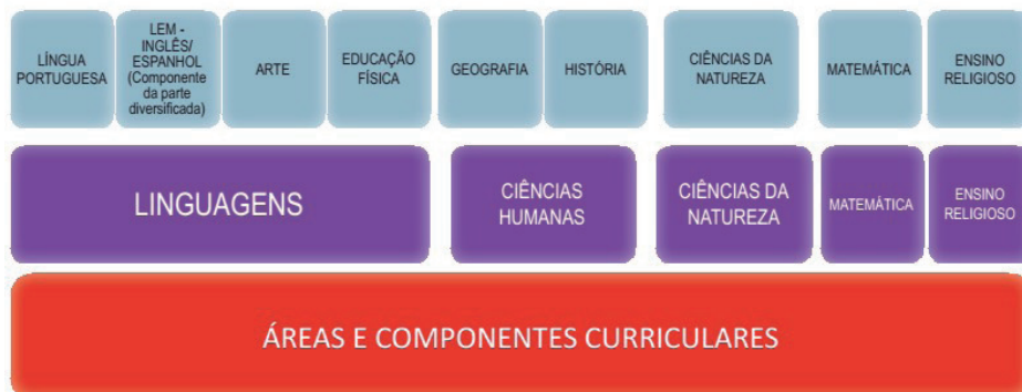
Figura 3 – Áreas de Conhecimento e Componentes Curriculares do 6º ao 9º ano