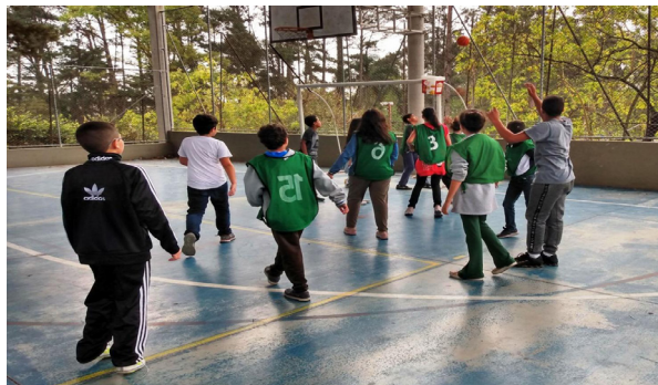
Jogos de acordo com as primeiras regras do basquete de 1891

Após as partidas, as/os estudantes relataram ter gostado de jogar com aquelas regras e o balde colocado não tão alto quanto a cesta facilitou para fazer os pontos. Seguindo na investigação do porquê do basquete ter tantas regras e se de fato tudo era falta, perguntamos, por que as regras do basquete mudam de tempos em tempos e quais mudanças observaram. De acordo com as/os estudantes, as alterações das regras ocorrem para que o jogo pudesse evoluir, tornando-o mais competitivo e interessante, ou para deixá-lo mais fácil ou difícil. Apontaram a alteração das cestas, inclusão das tabelas, quantidade de jogadoras/es, pontuação, tempo de jogo e roupas utilizadas por atletas. Simultaneamente, identificamos as principais mudanças nas regras (pontuação e quantidades de faltas) entre os anos de 1891 e 1980, a partir das leituras dos textos The Penalties 94 e A Era dos 3 pontos na NBA – Parte 1 95 . Encerramos a conversa combinando que faríamos jogos de acordo com as modificações citadas.