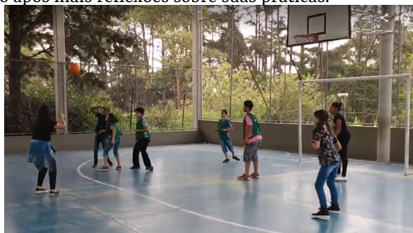
Jogos reduzidos, vivência com jogos 4x4

são sobre os jogos do dia, os meninos disseram perceber que haviam feito isso e, que quando perceberam, mudaram sua postura. Outro menino disse que se sentiu bem no jogo porque acreditou na coletividade e considerou uma estratégia importante incentivar as/os colegas a tentarem fazer cesta. Uma menina da turma disse que outro fator que facilitou a maior participação das crianças durante os jogos foi a redução do número de participantes por equipe, pois dava, segundo ela, maior acesso a todas as crianças que a compunham para jogar. Dessa forma, encerramos a aula levantando os três pontos primordiais que haviam percebido nesses jogos. Destacaram a coletividade, o respeito e o número de jogadores/as. Como proposta de fechamento, fizemos jogos de 4x4 para que pudéssemos observar as crianças jogando após mais reflexões sobre suas práticas.