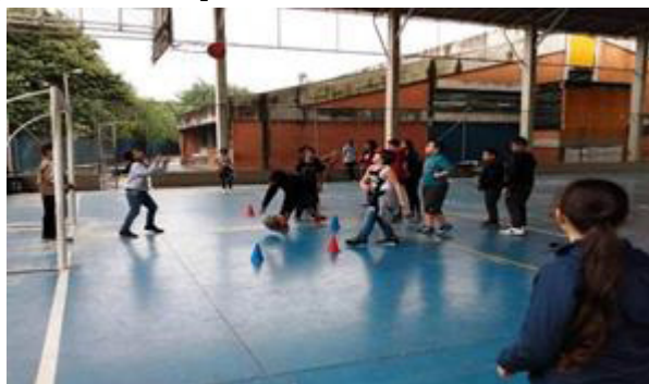
Estudantes vivenciando diferentes formas de executar o arremesso

Perguntamos o que era preciso para acertar a bola na cesta. As crianças citaram força, jeito, mira, precisão, treinar bastante, agilidade, habilidade, concentração, pensamento rápido, tática, sincronização, prática, resistência, visão, altura, pular alto, reflexo, inteligência, flexibilidade. Fomos até a quadra experimentar as hipóteses citadas.